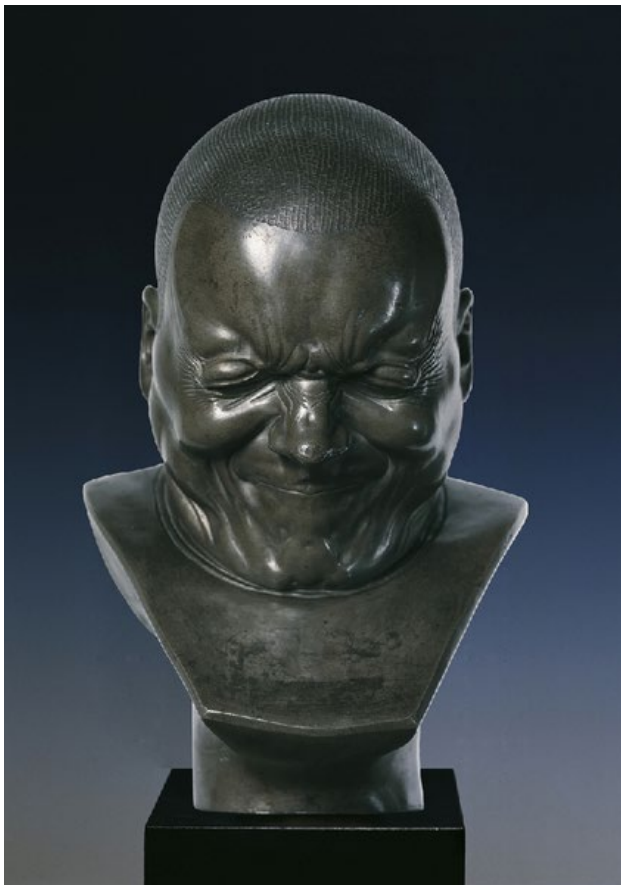
Een aartsbooswicht Franz Xaver Messerschmidt na 1770 Gypsum Alabaster hoogte 38,5 cm Österreichische Gallerie Belvedere Wenen, Oostenrijk

Studenten van het vak Forensische Psychiatrie en Psychologie, UoC