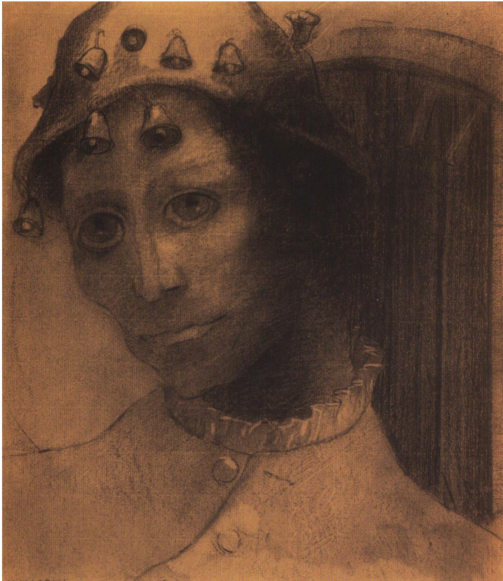
La folie Odilon Redon 1883 houtschool op papier Musée du Louvre Paris, Frankrijk