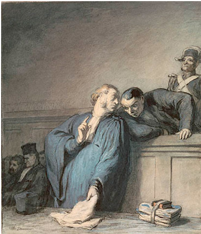
A criminal case